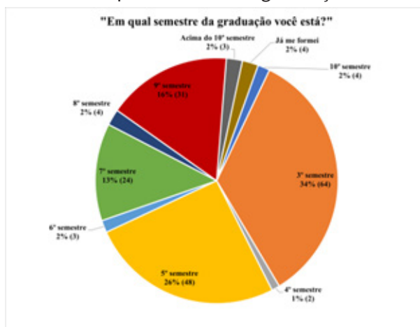
Gráfico 4: Em qual semestre da graduação você está?