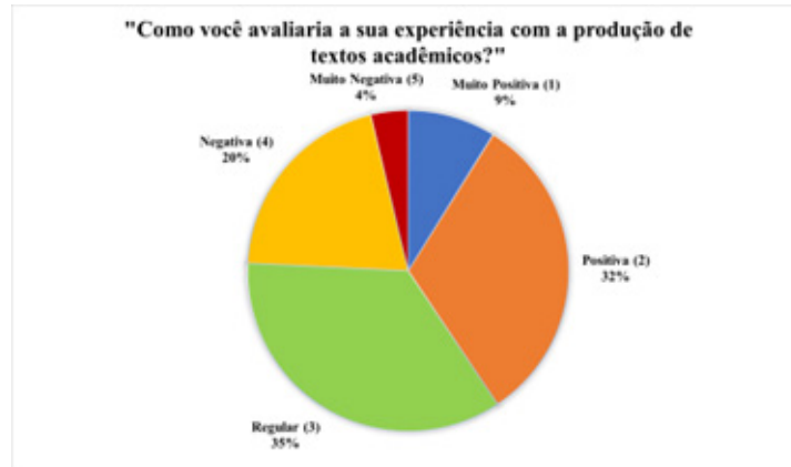
Gráfico 2: Como você avaliaria a sua experiência com a produção de textos acadêmicos?