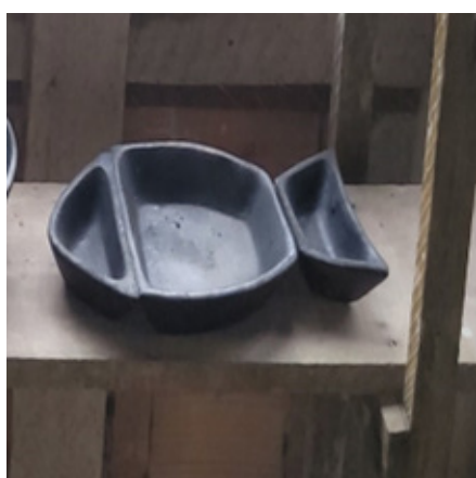
Imagem 11 – Formato de peixe