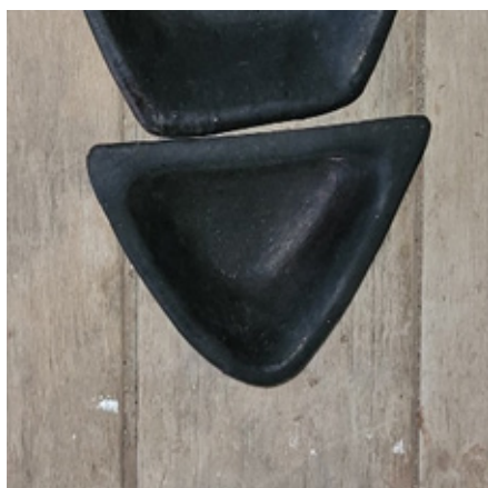
Imagem 9 – Triângulo