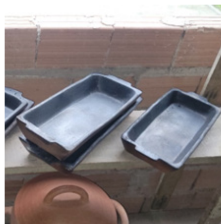
Imagem 10: Quadrilátero