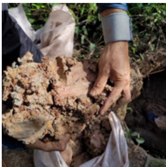
Imagem 3 – Argila em natura