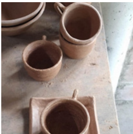
Imagem 7 – Círculos