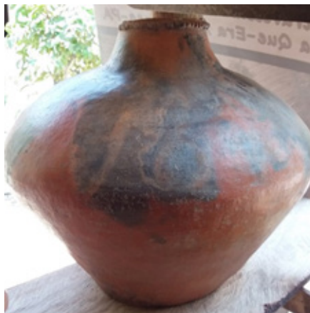
Imagem 2 – Peça de cerâmica caeteuara centenária

É com orgulho que a família Furtado 3 , guardiã de uma das poucas tradições ceramistas remanescentes na região bragantina, exhibe peças ancestrais, cada uma carregando uma porção da memória familiar (imagem 2). Essa herança, transmitida ao longo das gerações por meio da tradição oral, é mais do que simplesmente fazer cerâmica; é manter viva a memória de seus antepassados. A oralidade, neste contexto, não é apenas uma maneira de transmitir conhecimento, mas também de conectar e entrelaçar gerações (Almeida, 2017).