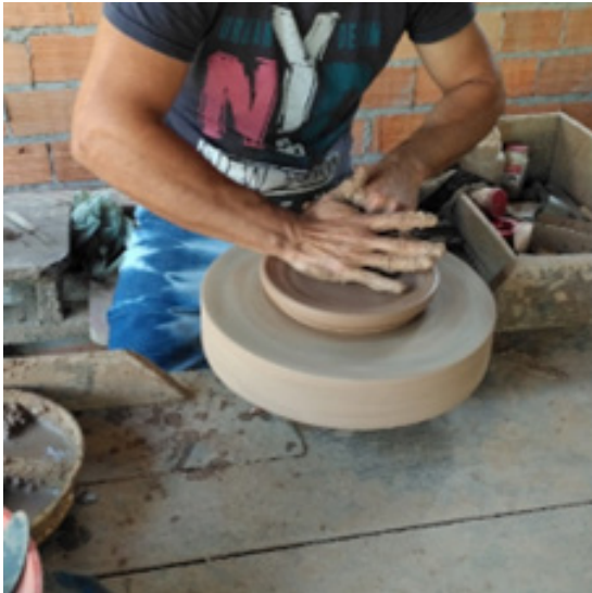
Imagem 5 – Figura plana inicial