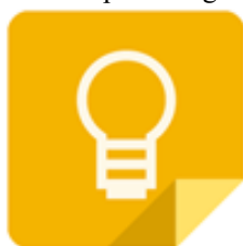
Figura 3 - Laboratório de Aprendizagem com Google Keep

A partir do diálogo e das discussões acerca das propostas, decidiu-se trabalhar com a ferramenta Google Keep , dado que era gratuita, disponível em smartphones , tablets e computadores de maneira acessível, além de oferecer espaço para a criatividade e a diversão, bem como atendia aos objetivos da ação. Com o Google Keep , é possível fazer blocos de notas, guardar textos, gravar anotações de voz, armazenar imagens, lembretes e desenhos e ainda compartilhar com o Google Docs e com outras pessoas (Figura 3).