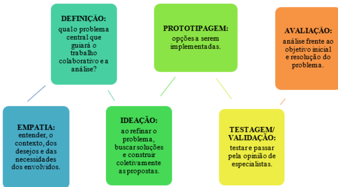
Figura 1 - Etapas da abordagem metodológica Design Thinking