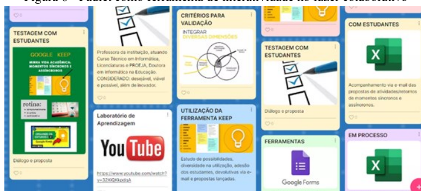
Figura 6 - Padlet como ferramenta de interatividade no fazer colaborativo