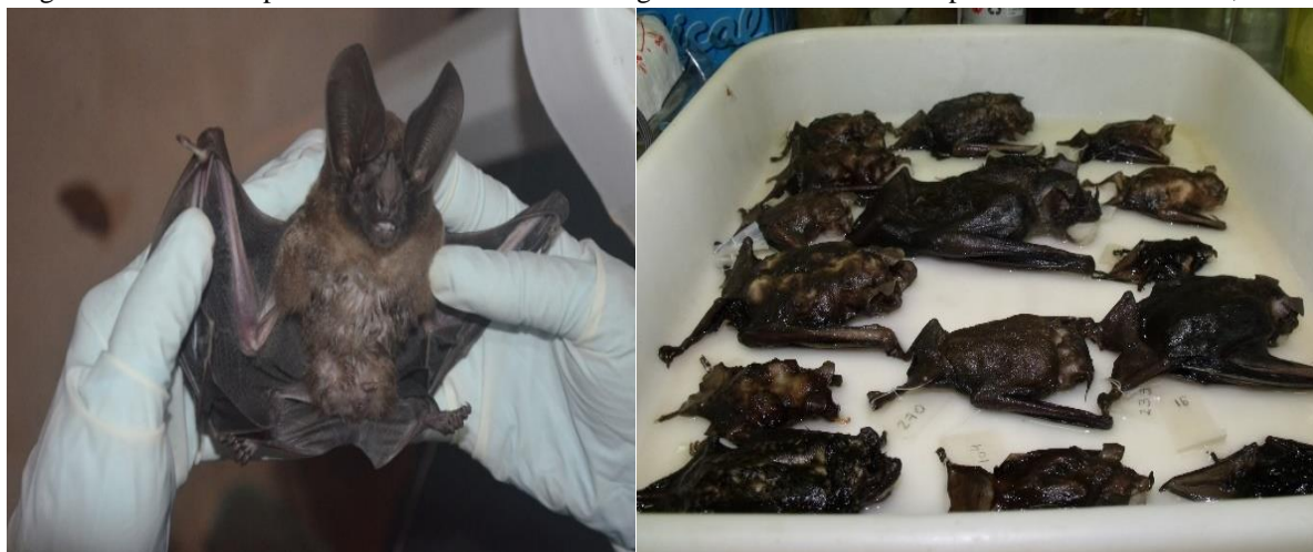
Figura 3 - Atividade prática em laboratório com os agentes de saúde do município de Pontes e Lacerda, Brasil