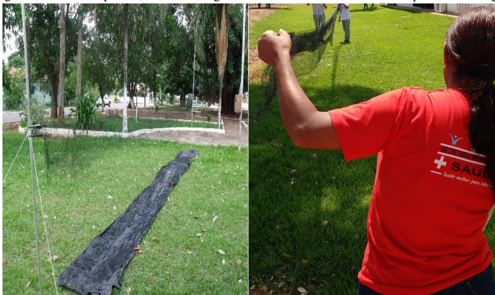
Figura 4 - Atividade prática, com a montagem de redes de neblina, usadas na captura de morcegos