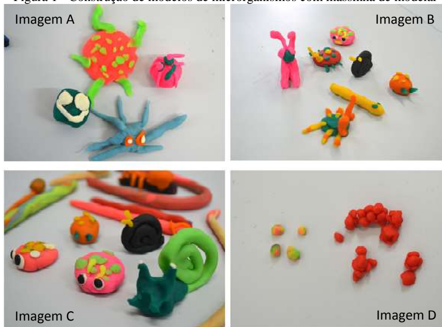
Figura 1 - Construção de modelos de microrganismos com massinha de modelar

nocivos e perigosos. Lopes et al. (2015), sinalizam que essas representações midiáticas podem gerar concepções alternativas para os alunos, às quais devem ser problematizadas pelo educador em sala de aula. Também foi comum a representação como insetos e/ou outros invertebrados. Costa Neto e Carvalho (2000) apresentam que o senso comum julga os insetos como sendo organismos nojentos, perigosos, repugnantes e inúteis para a sociedade. Dessa forma, por vezes, as crianças os consideram micróbios.