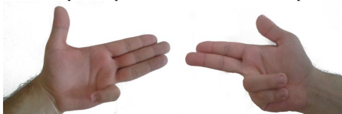
Figura 1 - Mão esquerda representando o 6 e a mão direita representando o 7